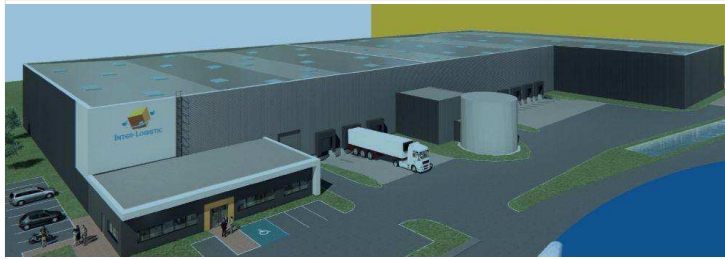
Inter-Logistic mettra en service une première tranche en septembre 2019.

Le 7 juin, c'était le prestataire logistique local Inter-Logistic qui posait officiellement sur place la première pierre d'un bâtiment construit par LCR (Les Constructeurs Réunis) et en fait, déjà bien entamé : « Nous mettrons en service une première tranche de 3.500 m2 en septembre prochain puis une seconde de 5.500 m2 à la fin de cette année, pour un investissement total de 5,7 millions d'€ », annonce le dirigeant-fondateur Frédéric Réveillé .