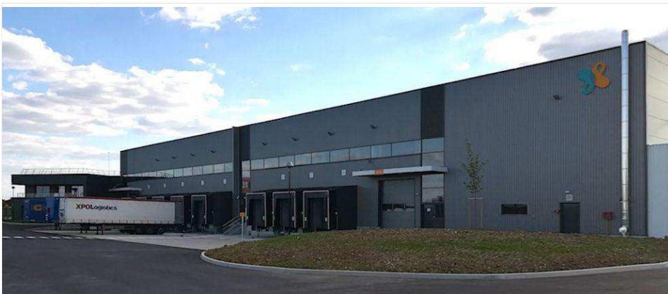
La nouvelle plate-forme de Paredes est dotée d'un service "drive" qui permet de livrer une commande urgente en une heure.

Construite par l'entreprise Anthylis, la nouvelle plate-forme de Paredes se compose de deux cellules qui entreposent une gamme de 2.300 articles sur trois niveaux jusqu'à 8 mètres de hauteur. Ses flux actuels totalisent 12.500 lignes de commandes et 330.000 unités de « picking » mensuelles. Le délai d'un mois est en effet celui de référence : il correspond à la durée la plus fréquente de stockage sur place. Les livraisons, elles, sont quotidiennes. « Nous sommes mêmes dotés d'un service drive, sur le principe de la grande distribution, qui permet de chercher en une heure une commande urgente », souligne Serge Riff, directeur régional.