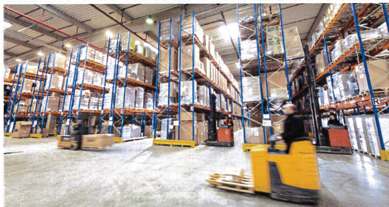
Inter-Logistic a trouvé dans le Territoire de Belfort, un entrepôt de 8000 m2 pour développer une activité de logistique inversée et de e-commerce.

LOGISTIQUE/FRANCHE-COMTÉ. La société de logistique industrielle a quitté son Alsace natale pour s'installer en Franche-Comté, sur l'aéroparc de Fontaine, aux portes de Belfort. Inter-Logistic y a trouvé la surface nécessaire à son développement dans la logistique inversée et le e-commerce.