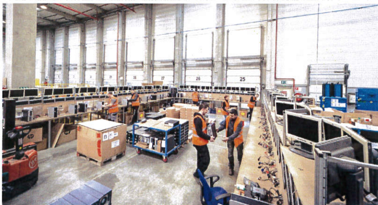
Un entrepôt labellisé ICPE (qualité environnementale).

( http://www.bfc.experts-comptables.fr/ )